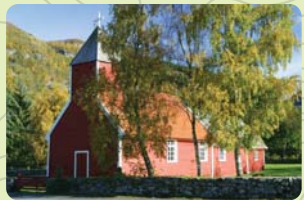
Årdal gamle kyrkje