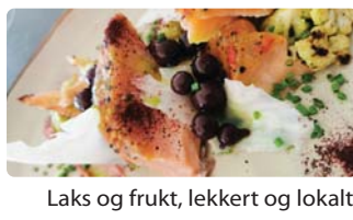
Laks og frukt, lekkert og lokalt